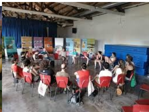
Cartellera i sessions de l'Escola d'Estiu 2019.