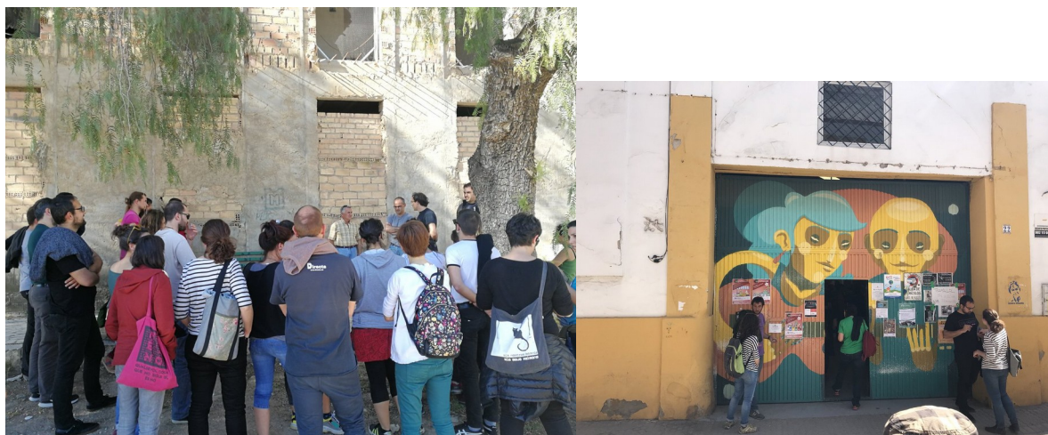
Visita al municipi de Marinaleda: ajuntament i cooperativa de producció i transformació agrària Visita a l'espai de co-treball cooperatiu Tramallol.