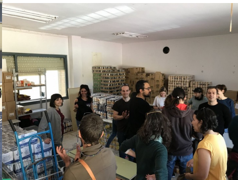
Visita a l'Associació vencedores, del barri de les 3.000 Viviendas de Sevilla.