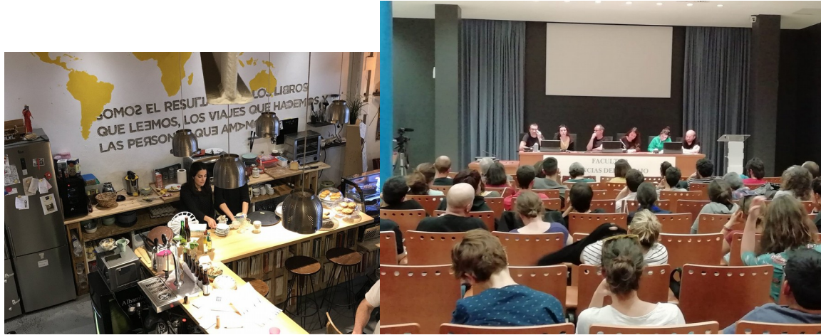
La Caótica, Sociedad Cooperativa Andaluza. Trobada cooperativisme català (Coòpolis BCN, Coop Maresme), basc (Lanki-Mondragón, Olatukoop) i andalús (Autonomia Sur, El Topo).