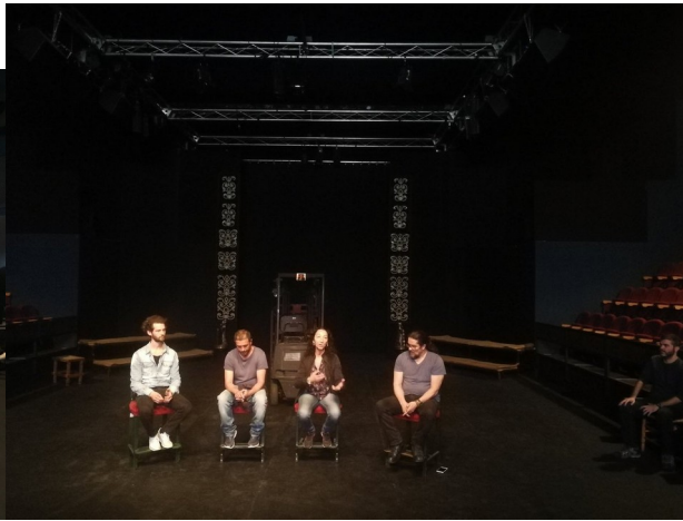
Visita al teatre Cooperatiu La Quadra de Sevilla.