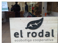
El Rodal, ecobotiga cooperativa Sabadell (Carles Sedó)

Ferit passos cap a una economia solidària intercultural