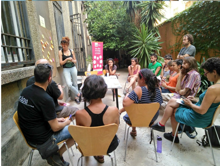
[III ESCOLA ESTIU XES SESSIÓ INAUGURAL 29 JUNY 2018 ]