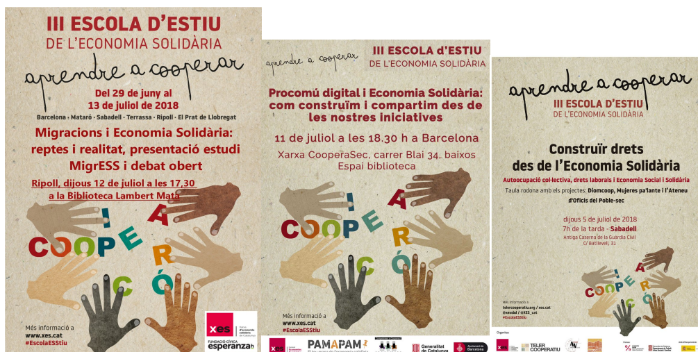
Difrents sessions de l'Escola d'Estiu 2018.