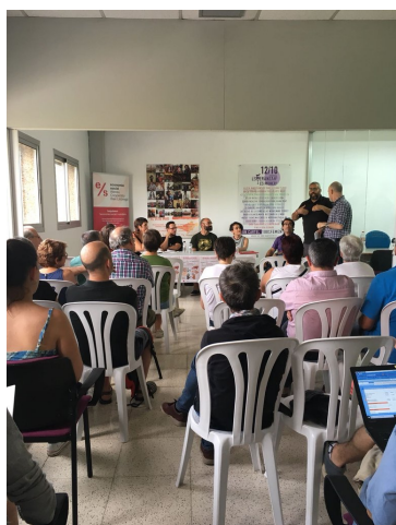
“Cultura cooperativa” al Prat de Llobregat, cloenda Escola 2018.